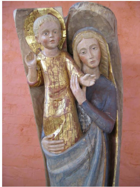
Muttergottes-Statue St. Martin Lagerlechfeld